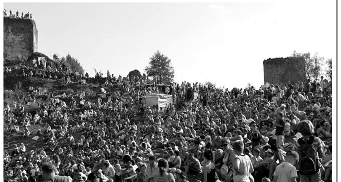
Takéto davy ľudí sledovali hlavný program na hradnom vrchu.

Na hry prišli aj predstavitelia samospráv partnerských miest Veľkého Šariša – poľského Grybowa, maďarského Nyirteleku a ukrajinského Rakošina. Medzi účinkujúcimi bol tiež jeden zahraničný kolektív šermiari Rycierzy chorągwi ziemi Sandomierskiej z dvoch poľských miest Sandomierz a Staszów. (j)