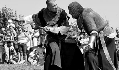
Šermiari z prešovskej skupiny Cohors zabávali návštevníkov hier vystúpeniami na lúke pod hradom.