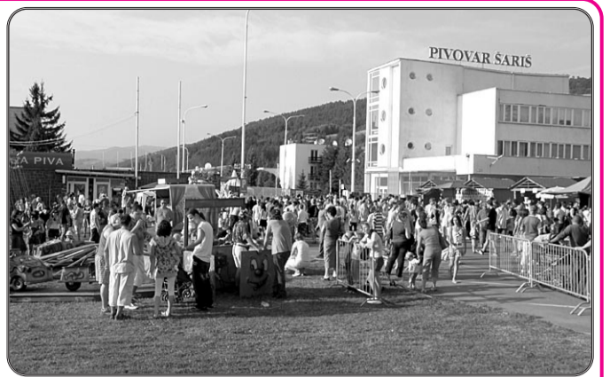
PIVOVAR ŠARIŠ PRÁSKAL VO ŠVIKOVCH Deň otvorených dverí v pivovare Šariš je už podujatie, ktoré vie sústrediť tisíce vyznávateľov nielen penivého moku, ale aj mladých priaznivcov hudby. Nebo to ináč ani tohto roku v sobotu 6. septembra. Viac na s. 5.