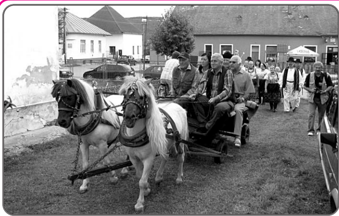
ŽIVLOVANIE PRILÁKALO VYZNÁVAČOV REMESIEL Tvorivé dvojdné pod názvom Živlovanie v objekte Levendovského kúrie počas víkendov 23. a 24. augusta našlo svojich prívržencov v mnohých mladých, ktorým nie sú vzdialené rôzne remeslá. Viac na s. 7.