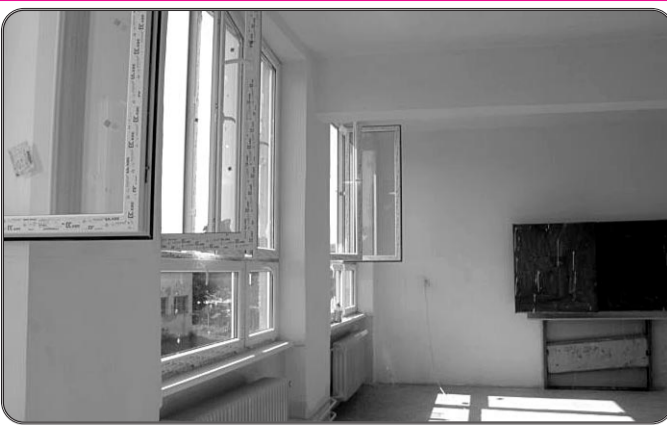
JEDEN PAVILÓN ŠKOLY JE UŽ OPRAVENÝ Pavilón pod poradovým číslom 4 v areáli veľkošarišskej základnej školy je už z podstatnej časti obnovený. Najviac udrá do očí vymenené okná. No veľa zmien je aj pred očami schovaných. Viac na s. 5.